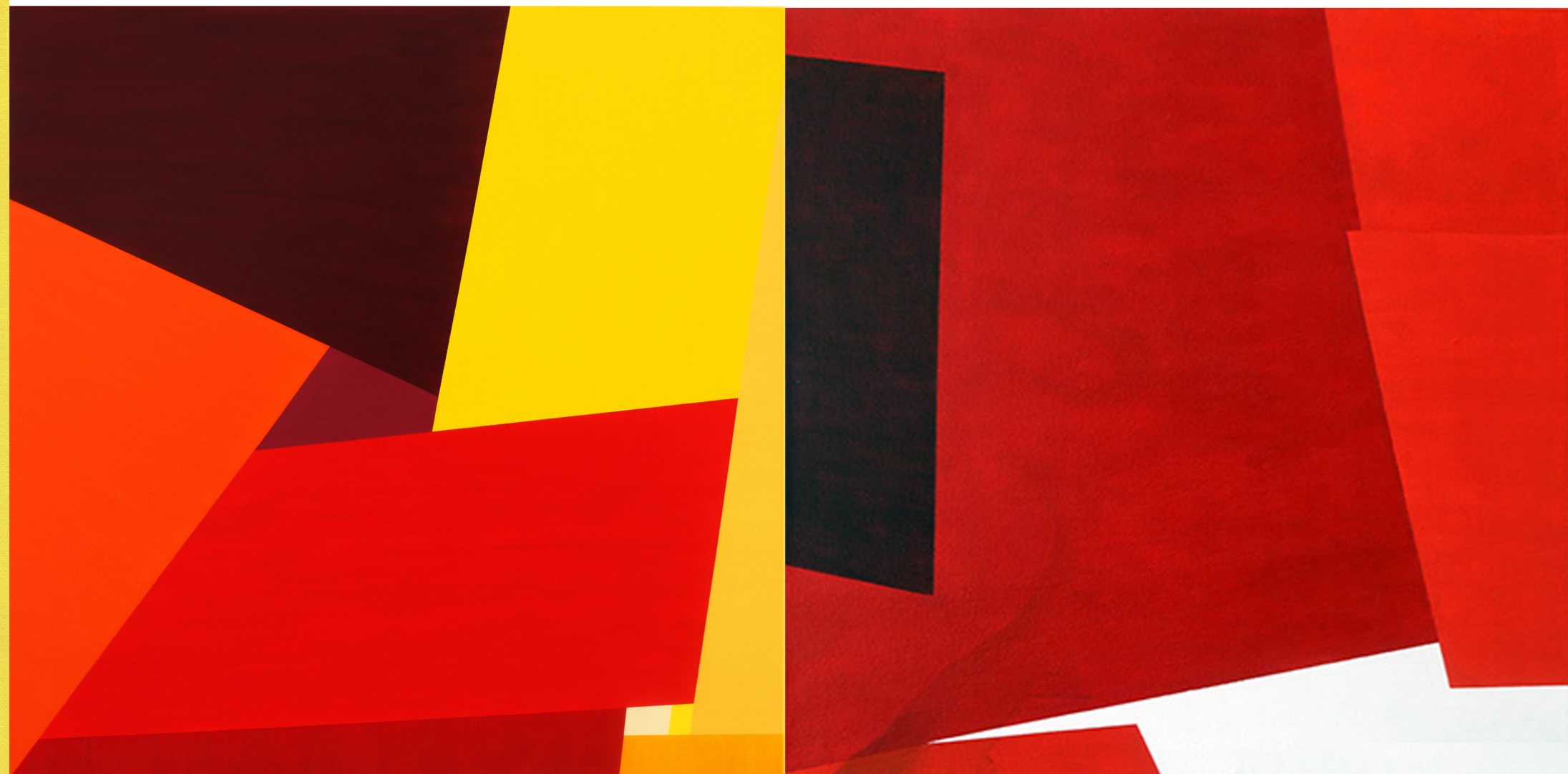
ACERCAMIENTO #13 | acrílico sobre lienzo | 36" x 36"

Culminó un Grado de Maestría en Artes con Especialidad en Pintura y Dibujo (2016), del Programa Graduado del Departamento de Bellas Artes de la Pontificia Universidad Católica de Puerto Rico. Se ha desempeñado como Profesor de Bellas Artes y Comunicaciones para la PUCPR y como gestor cultural ha coordinado proyectos para la Galería Trinitaria y La Galería @ Plaza del Caribe. Actualmente, dirige esfuerzos para continuar desarrollando El Anexo: Espacio de Arte (2020).