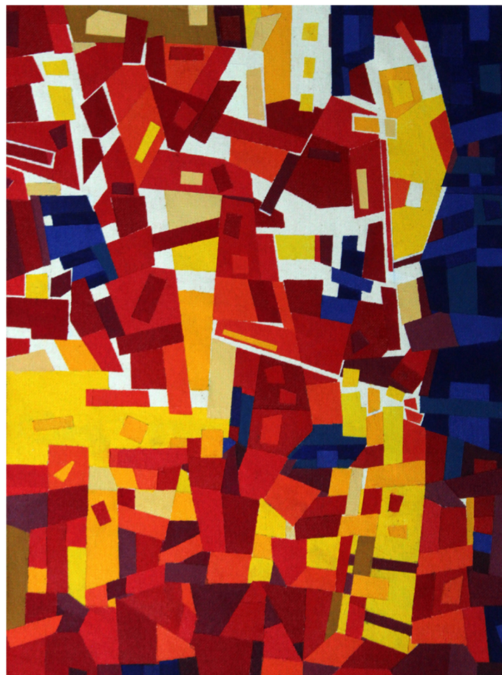
Arreglo Aleatorio 01 , 2019

Otro asunto que gusta de balancearse mucho en la historia del arte, es la tangencia entre la ciencia y las humanidades. Pasamos por alto en ocasión que el arte, al igual que el método científico, comienzan y necesitan de la observación directa, repetida y prolongada, en la espera del encuentro hacia pistas por un resultado, generado con el pensamiento creativo, en ambas esferas. Entonces, la búsqueda de la originalidad (pensemos en la idea del "origen" de las cosas para complicarlo aún más), no se remite a un polo del conocimiento, sino que gravita en tantas direcciones. Consideremos entonces el origen de la investigación que Ludwig nos presenta con ACERCAMIENTOS: representaciones al límite de lo máximo . En un comienzo su investigación ocurre con una composición adrede azarosa. Cabe aquí preguntarse cómo se logra el azar, cuando las decisiones provienen de una mente tan educada y cautelosa como la de este artista.