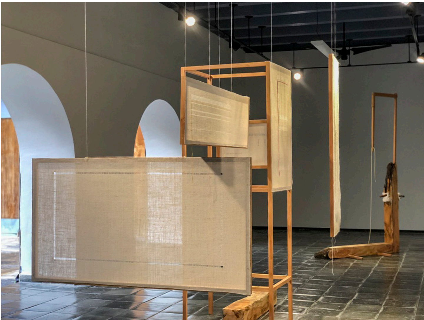
Contorno deshilado. 2019 vista parcial