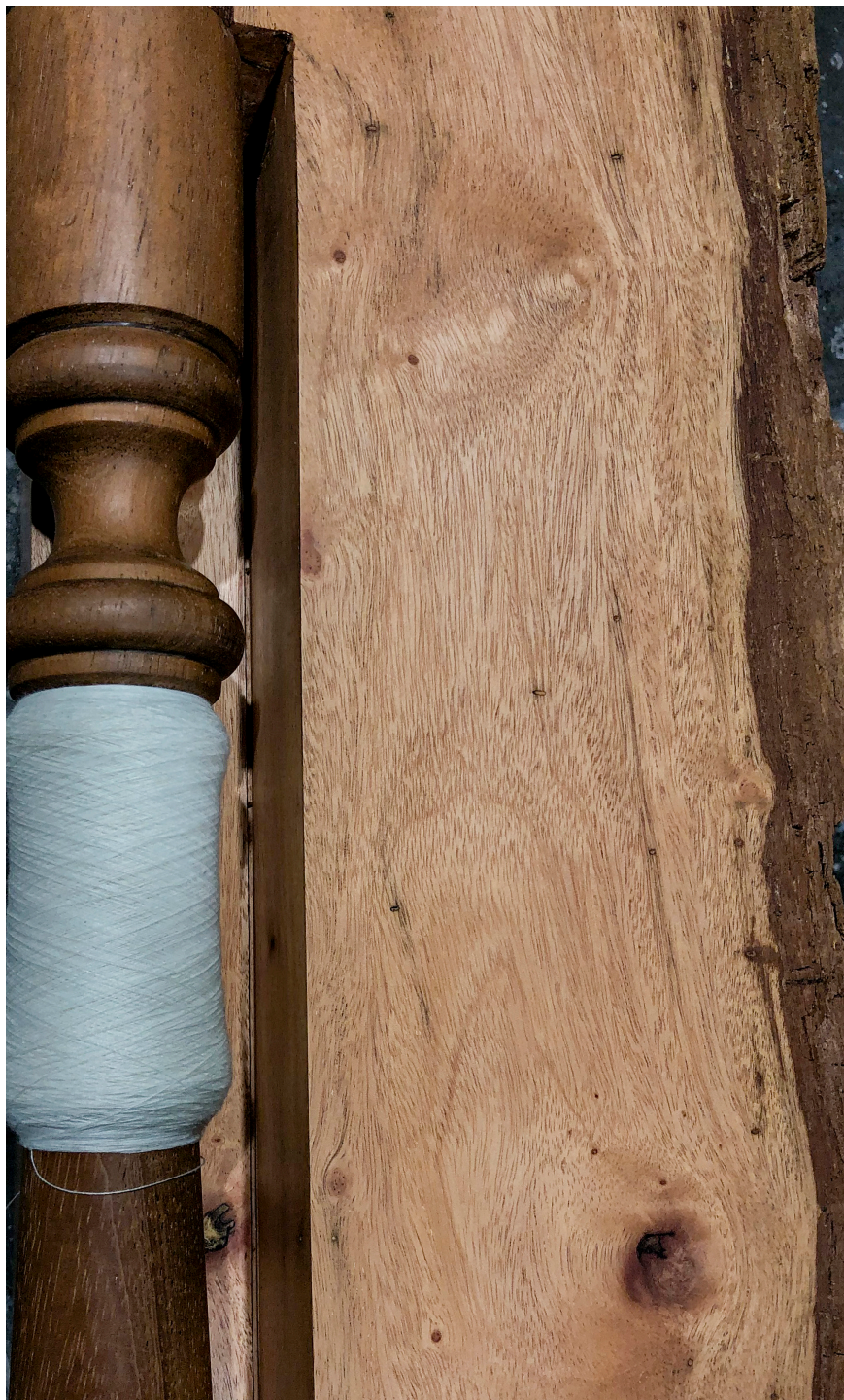
Contorno deshilado [b].2019 Madera, hilo de algodón, acero inoxidable (detalle)