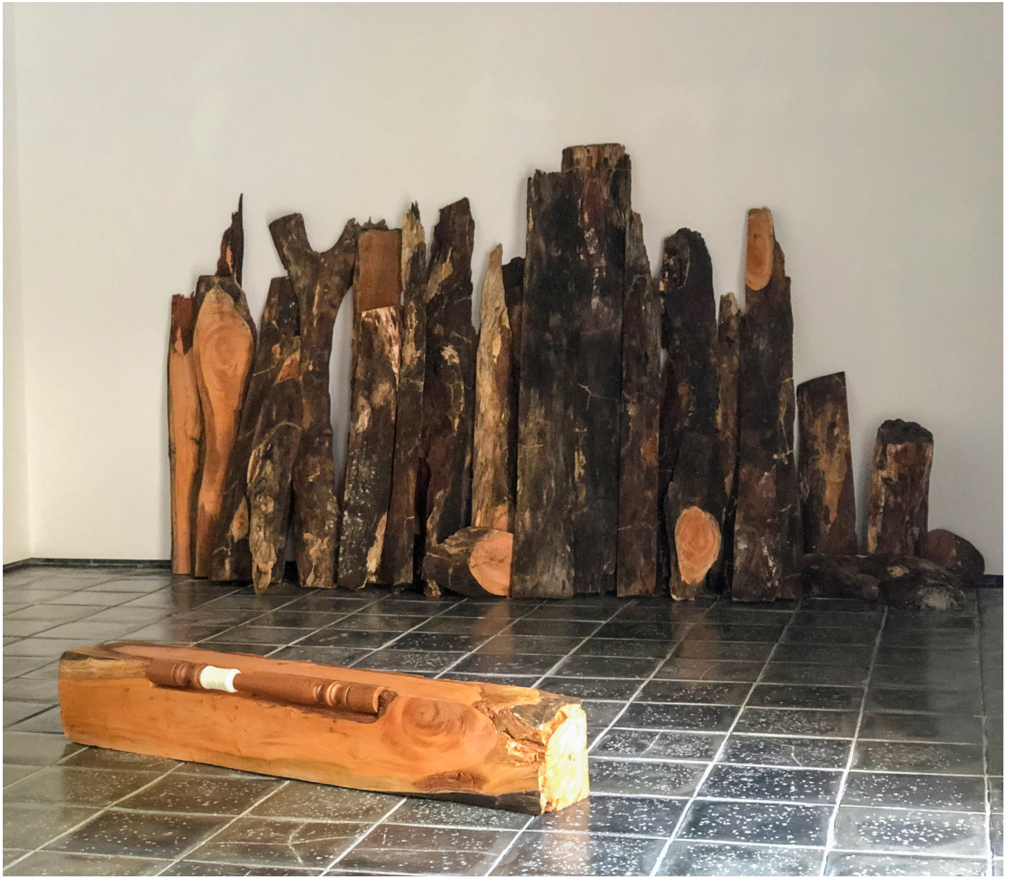
Contorno deshilado. 2019 vista parcial