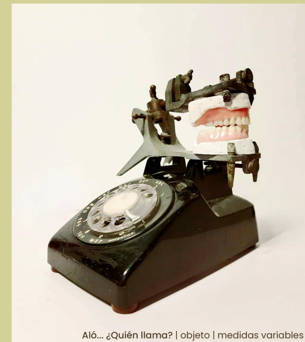
Aló... ¿Quién llama? | objeto | medidas variables