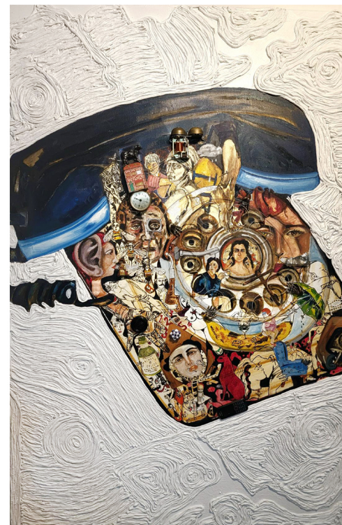
Discado directo (K500) | mixto/objeto | 72" x 48"