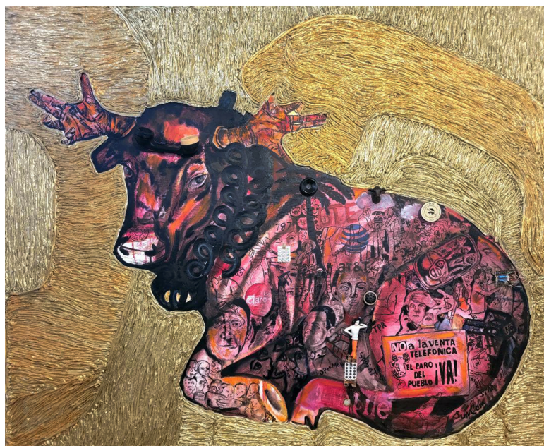
Fortunata | mixto/objeto | 60" x 72"