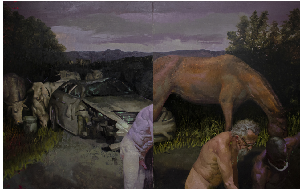
Posibles vidas | 2022 | óleo | 5' x 8'

La obsidiana, también conocida como "piedra de los abismos", ya que es una piedra de origen volcánico, se empleaba en usos militares y ritual-religiosos en varias culturas mesoamericanas. Hoy día, incluso, se utiliza en terapias sanadoras. Vemos cómo la obsidiana se ha utilizado tanto para la sanación individual como para la colectiva. En ese sentido, esta serie alude de cierta manera a cómo superar la historia de trauma y violencia que hemos vivido en Puerto Rico por todos los siglos de colonialismo que se suma a las experiencias en contextos de la cotidianidad: de la calle al entorno familiar y hasta las microagresiones.