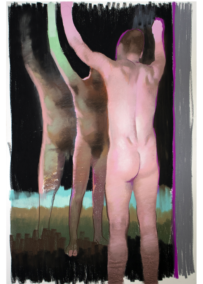
Recordar la cercanía | 2022 | pastel suave | 30.5" x 44"

Sentir que la vigilia es otro sueño que sueña no soñar y que la muerte que teme nuestra carne es esa muerte de cada noche, que se llama sueño.