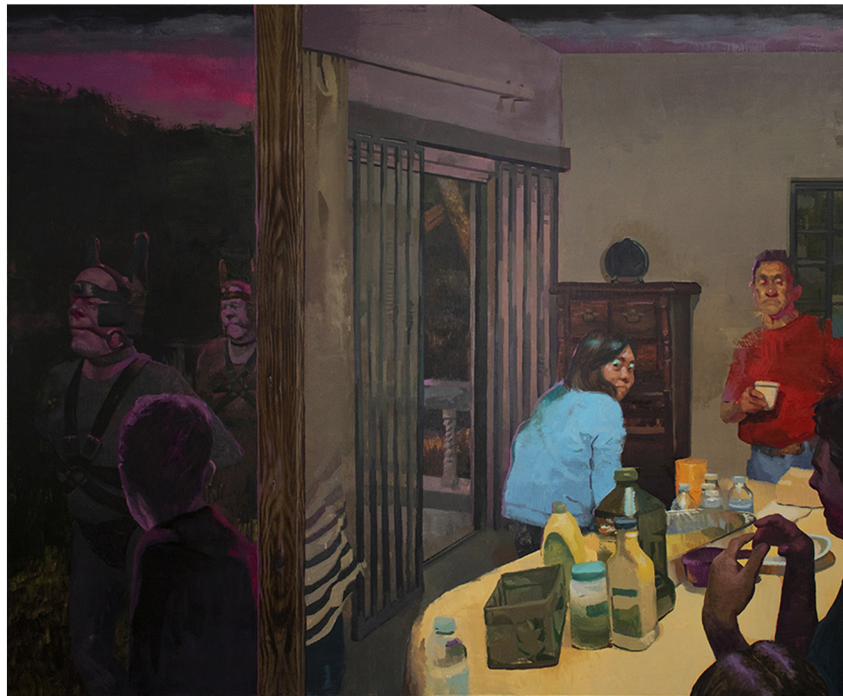
Consultar la piedra | 2022 | óleo | 5'x6'

Esta incesante búsqueda y curiosidad, sumada al interés de Malavé Maldonado por la historia son elementos fundamentales en su proceso de creación. Contrario a series anteriores, donde el artista delineaba un conjunto de hechos históricos con un fin didáctico, en esta ocasión, siguiendo la línea de la primera parte de la exposición "Sueños de obsidiana", Malavé Maldonado no se enfoca directamente en ese tipo de eventos. Cuando el artista desarrolla una serie se adentra en la narrativa y asume las posiciones de diferentes personajes dentro de la historia que está presentando, esto enriquece la obra. Este cuerpo de trabajo narra diversas anécdotas a través de la técnica empleada así como de la paleta de colores que, según nos comentó el artista, tiene que ver con el velo de la obsidiana, lo que se ve en el reflejo del espejo de esta piedra.