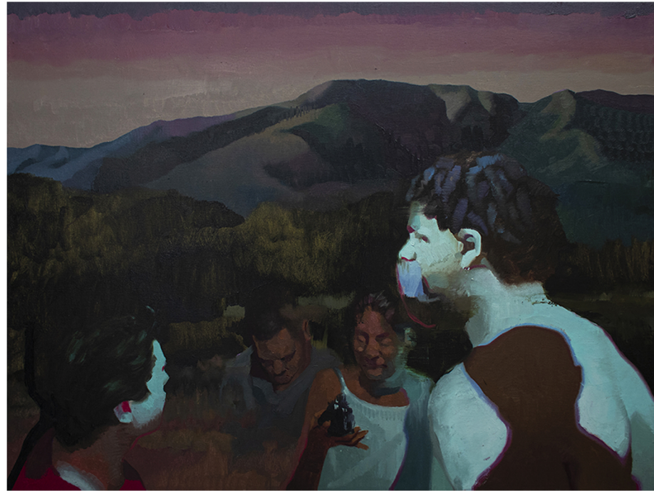
Revelarle que es alguien | 2022 | óleo | 30" x 40"

Adquiere el Grado Asociado en Tecnología de las Telecomunicaciones de la Universidad de Puerto Rico (2007). Cursó estudios en la Escuela de Artes Plásticas de San Juan en el Departamento de Pintura, del cual se graduó con honores (Magna Cum Laude, 2014). Durante su graduación del MFA en la Pennsylvania Academy of the Fine Arts fue galardonado con premios como el The Judith McGregor Caldwell Purchase Prize for the Academy's Permanent Collection y The Woodmere Art Museum Purchase Prize ambos premios acogen sus obras para sus colecciones permanentes. Tuvo dos muestras individuales, en La Productora y en El Cuadrado Gris, respectivamente. Ha participado de varias colectivas en museos como el Museo de Arte y Diseño de Miramar, Museo de Arte de Caguas, Museo de San Juan, Museo de Arte Contemporáneo. Su obra figura en varias de las colecciones más importantes de Puerto Rico. Actualmente vive y trabaja en Philadelphia.